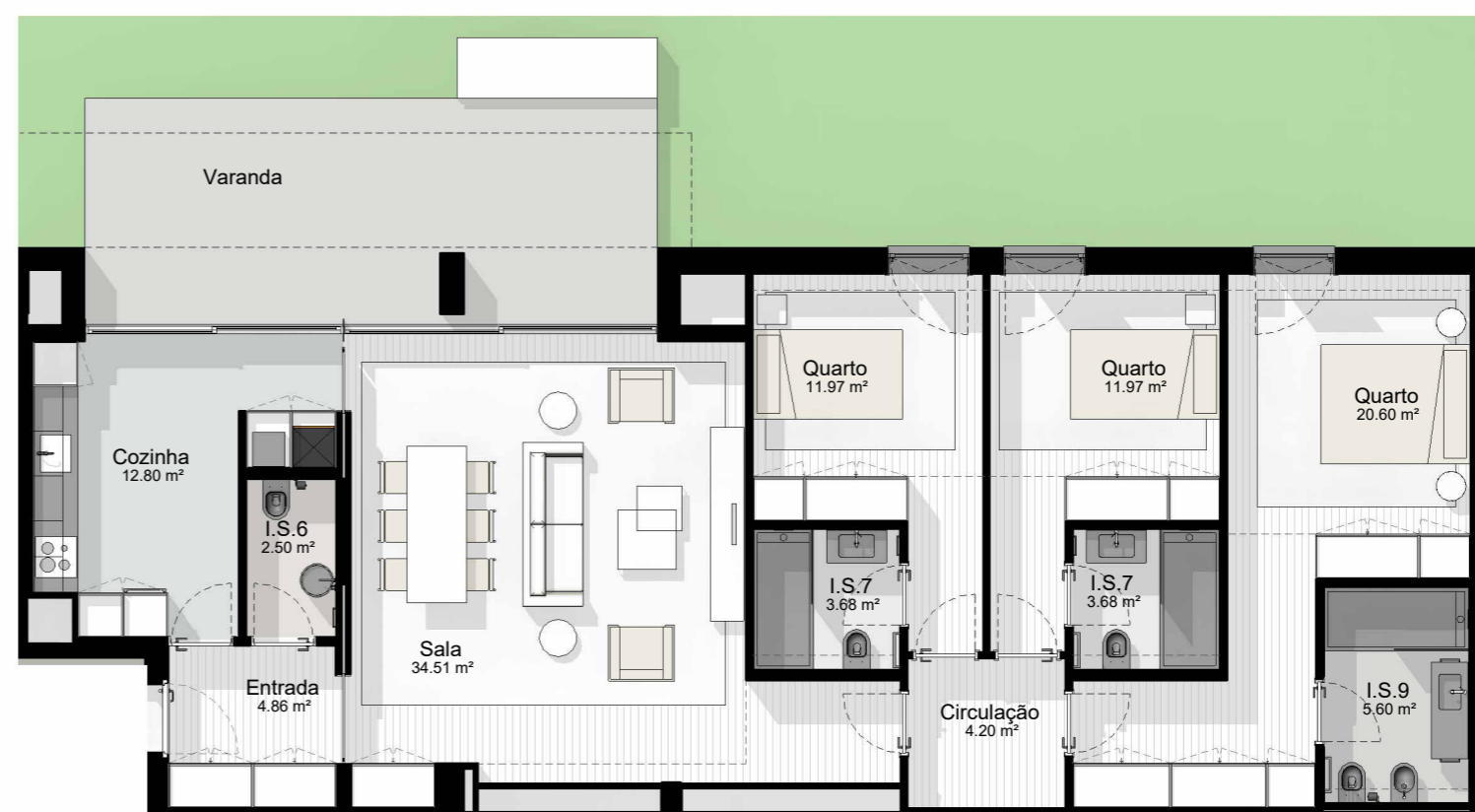
T3_3 - PLANTA 1 : 100

EDIFÍCIO CASTANHEIRO | HABITAÇÃO PLURIFAMILIAR | GUIMARÃES | JOM INVESTIMENTOS