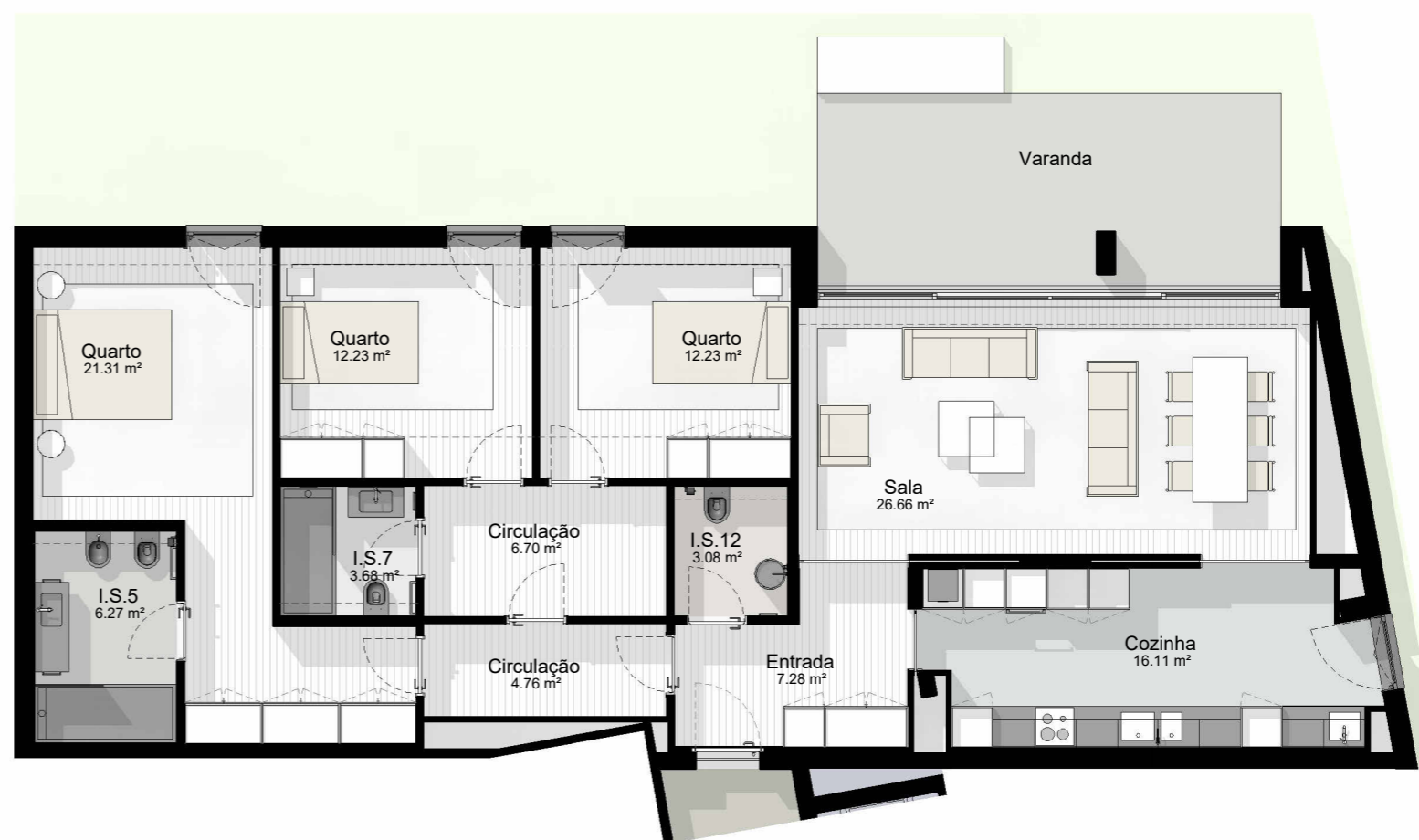
T3_7 - PLANTA 1: 100

EDIFÍCIO CASTANHEIRO | HABITAÇÃO PLURIFAMILIAR | GUIMARÃES | JOM INVESTIMENTOS