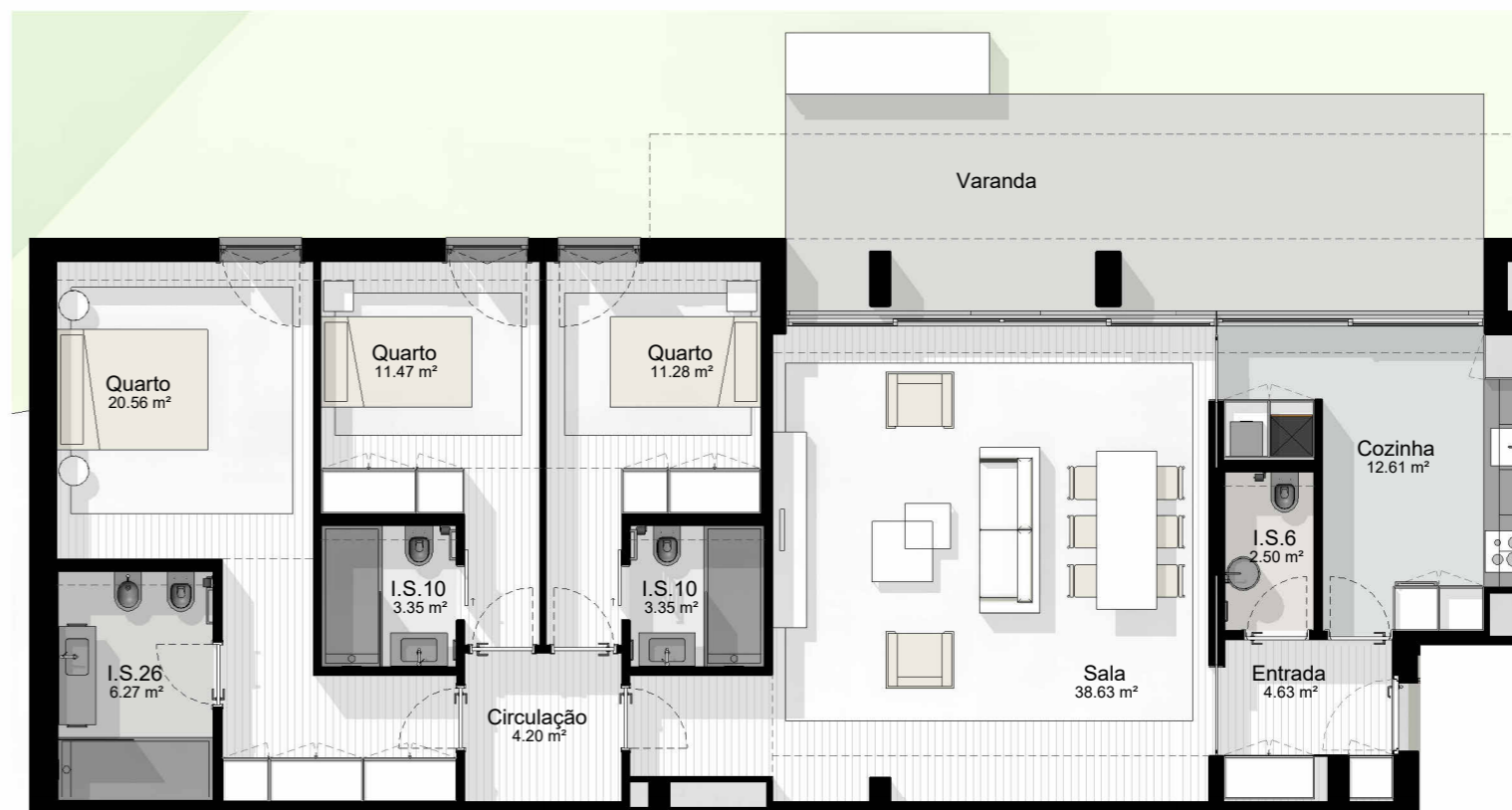
T3_5 - PLANTA 1:100

EDIFÍCIO CASTANHEIRO | HABITAÇÃO PLURIFAMILIAR | GUIMARÃES | JOM INVESTIMENTOS