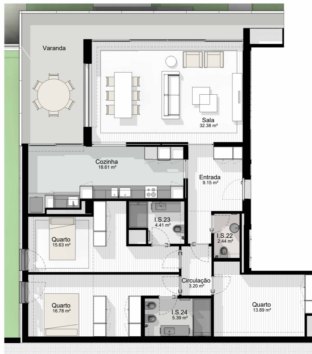
T2_3 - PLANTA 1:100

EDIFÍCIO CASTANHEIRO | HABITAÇÃO PLURIFAMILIAR | GUIMARÃES | JOM INVESTIMENTOS