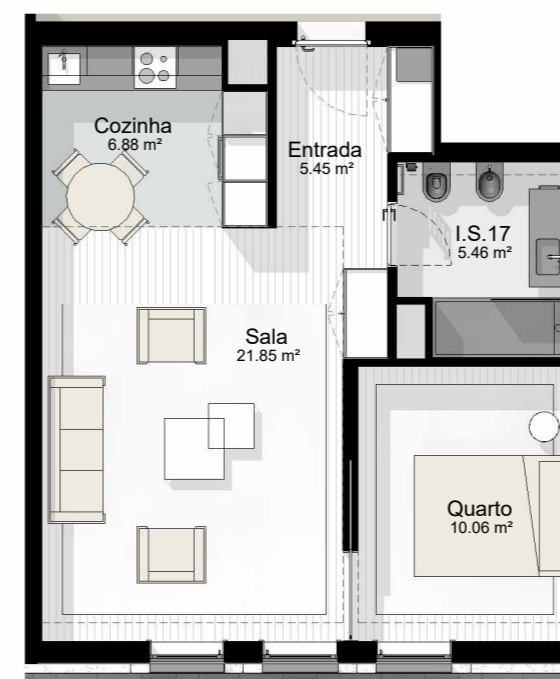
T1_3 - PLANTA 1 : 100

EDIFÍCIO CASTANHEIRO | HABITAÇÃO PLURIFAMILIAR | GUIMARÃES | JOM INVESTIMENTOS