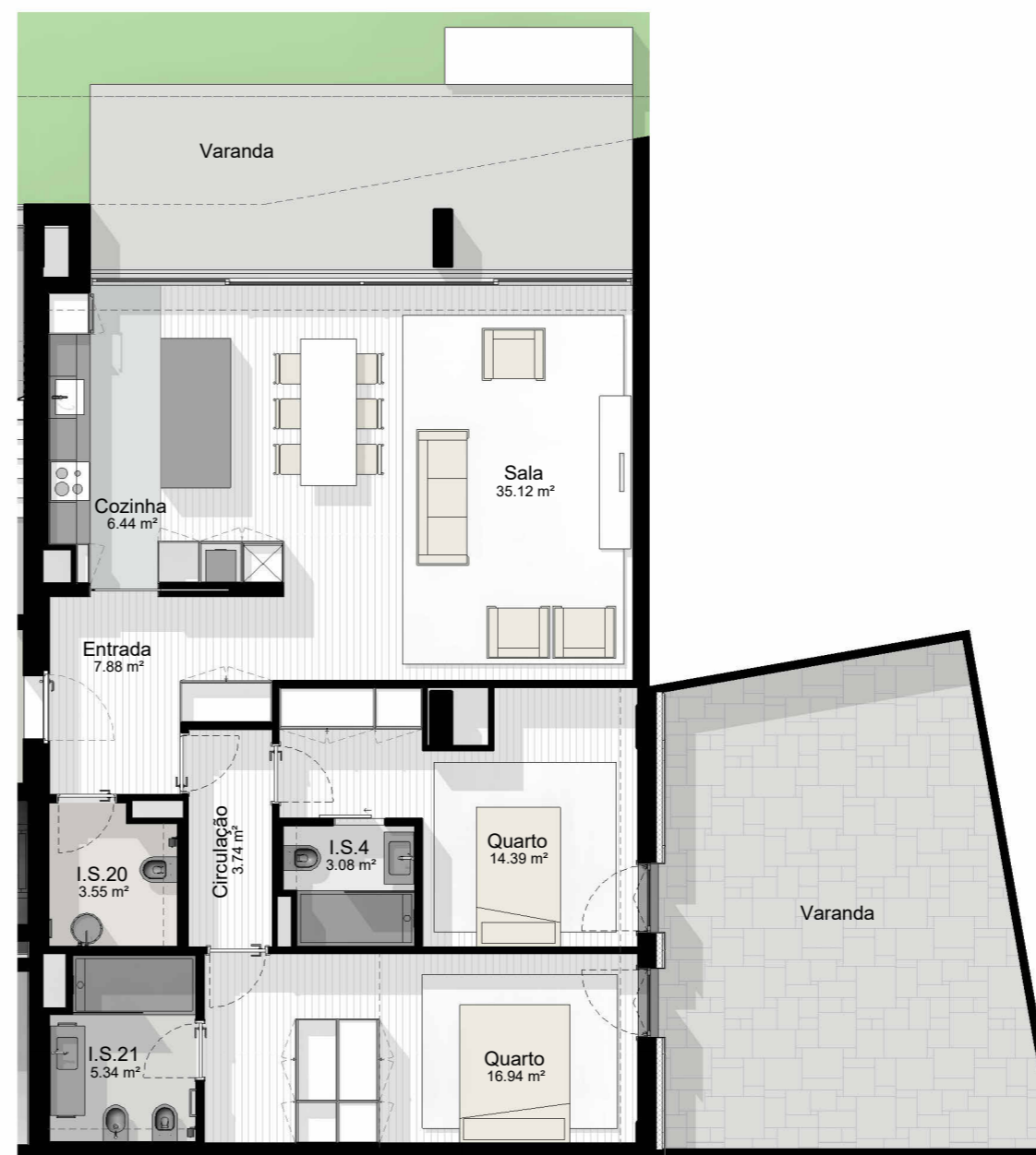
T2_2 - PLANTA 1 : 100

EDIFÍCIO CASTANHEIRO | HABITAÇÃO PLURIFAMILIAR | GUIMARÃES | JOM INVESTIMENTOS