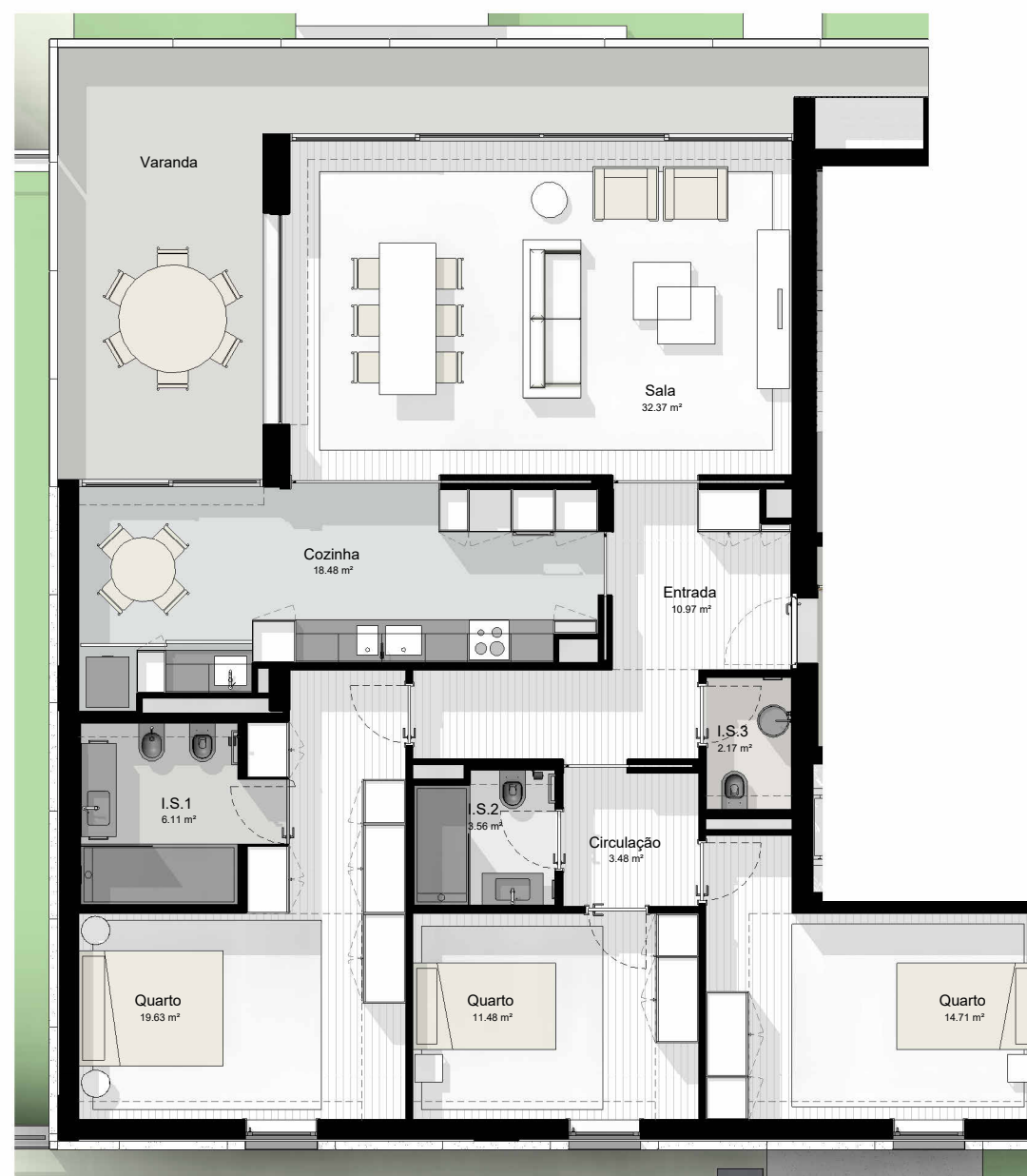
T3_1 - PLANTA 1 : 100

EDIFÍCIO CASTANHEIRO | HABITAÇÃO PLURIFAMILIAR | GUIMARÃES | JOM INVESTIMENTOS