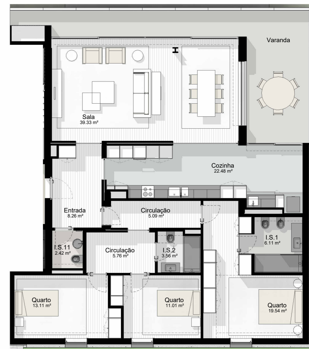
T3_6 - PLANTA

EDIFÍCIO CASTANHEIRO | HABITAÇÃO PLURIFAMILIAR | GUIMARÃES | JOM INVESTIMENTOS